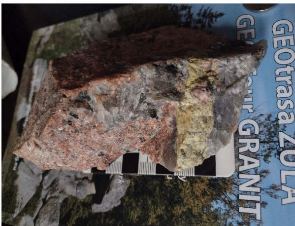
Beril în gnaise cu microclin, Grădiștea de Munte