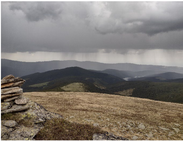
Acțiune în contratimp, M. Lotrulului