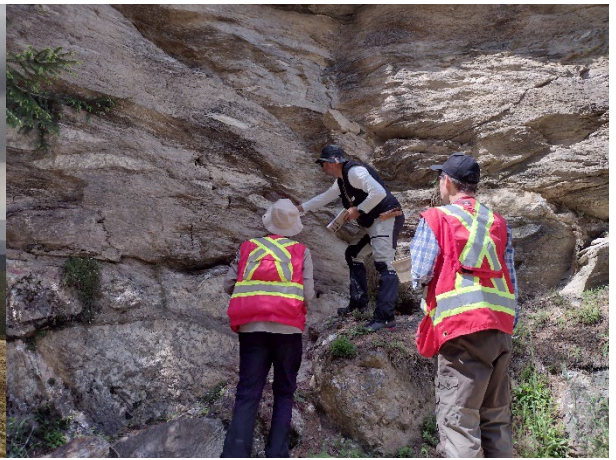
Măsurători structurale în domul de Cataracte împreună cu colegii de la BRGM