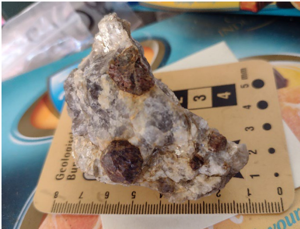
Pegmatit cu granat, Crîjma-Voislova, M. Mic