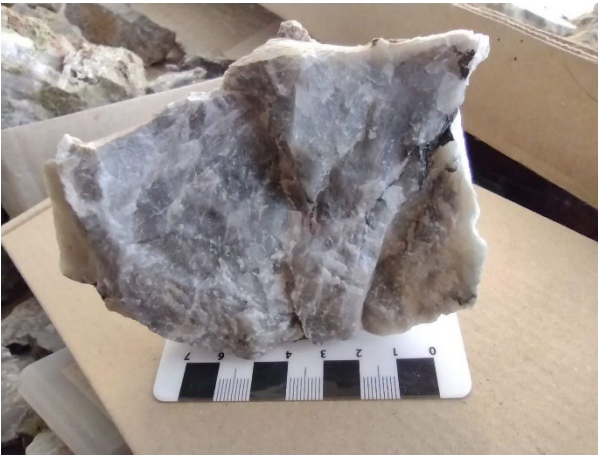
Nefelin pegmatitic, Güdüc, masivul alcalin Ditrău