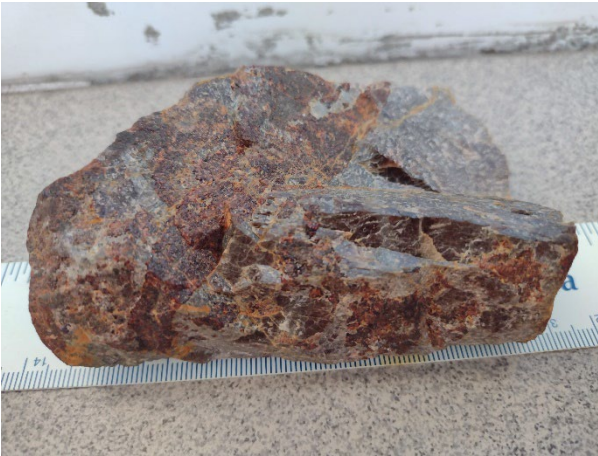
Pegmatoid cu piroxmagit, Răzoare, Preluca