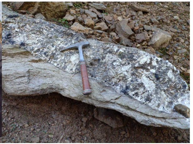
Filon pegmatitic în roca gazdă laminată, Valea Ierii, M. Gilăului