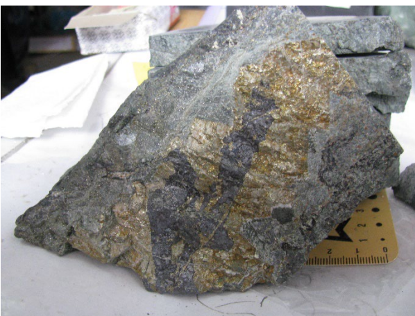
Minereu de Ti-Nb cu pirită, Jolotca