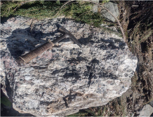
Pegmatit deformat cu granat și turmalină, p. Scărișoarei, M. Rodnei