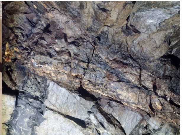
Filon cu mineralizație de Ti-Nb și lantanide, Jolotca