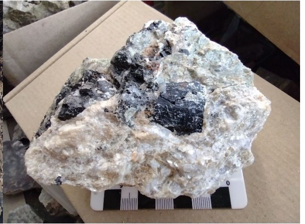
Turmalină și apatit în pegmatit, fosta mină Ciungi, Preluca