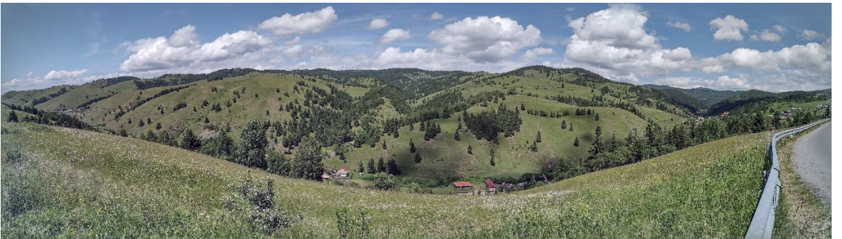
Imagine panoramică a câmpului mineralizat Jolotca